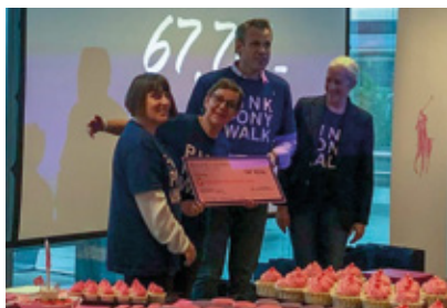
Semaine du Pink Pony - Ralph Lauren