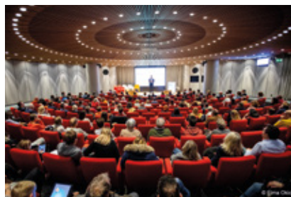
La Ligue genevoise était présente à la soirée de lancement de l'association «Action Margaux»

Devenir membre d'Action Margaux permet d'offrir un soutien individualisé aux personnes atteintes de cancer ou en rémission qui souhaitent maintenir ou retrouver une activité professionnelle. ■