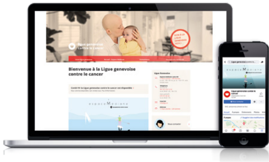
Nouveau site internet en ligne depuis juillet 2019 et page Facebook de la Ligue créée en décembre 2019

Initiée en 2018, La Ligue genevoise contre le cancer a décidé de prendre un tournant concernant ses outils de communication et son image.