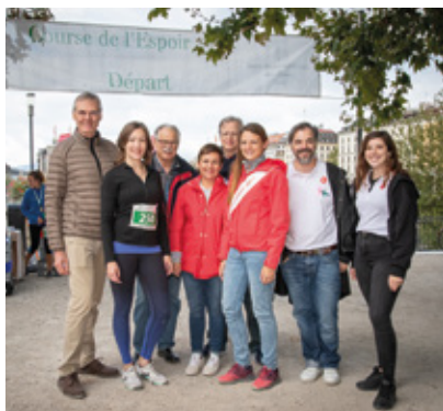
12 e course de l'Espoir en faveur de la Ligue genevoise contre le cancer

Fidèle au rendez-vous, la 12 e « Course de l'Espoir » organisée par le Four Seasons Hôtel des Bergues en faveur de la Ligue genevoise contre le cancer a eu lieu le dimanche 6 octobre. L'Île Rousseau a accueilli 543 coureurs et marcheurs dans une ambiance joyeuse et conviviale. La Ligue a récolté CHF 18'093.50.- pour soutenir les personnes malades. Nos chaleureux remerciements vont encore une fois aux organisateurs de ce magnifique évènement qui rencontre chaque année plus de succès. ■