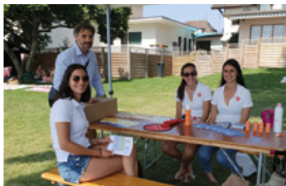
La prévention solaire dans les parcs et les piscines avec la contribution d'étudiants de la HEDS et les professionnels infirmiers de la LGC

Toujours présents pour soutenir les personnes atteintes de maladies cancéreuses, la semaine organisée au mois d'octobre par tous les collaborateurs de Ralph Lauren avec plusieurs événements tout au long de la semaine se clôture par une marche. Une équipe dynamique qui n'a pas manqué d'imagination et d'enthousiasme encore cette année. Elle a offert à la Ligue, grâce à tous ces événements, un chèque de CHF 69'124.42.- . Nous les remercions très sincèrement pour leur engagement sans faille.